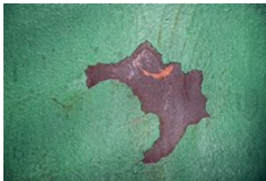
RESULTATET: Bildet av fergelemmen skal stilles ut på Nordfjordeid 28. mars.