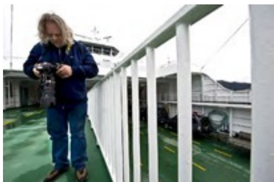
FERGEFOTO: På ferger MF «Lote» er det mange spennende motiver, blant annet når fergelemmene åpner seg.